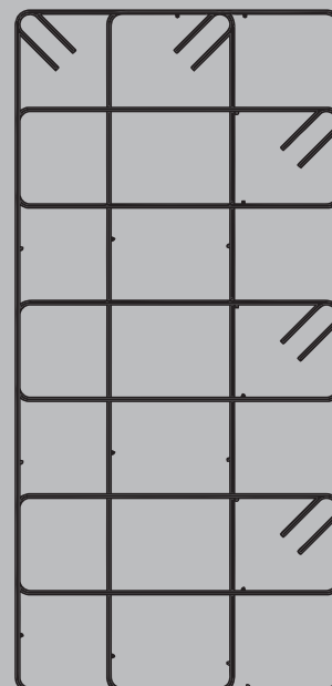
Κλωβός φωτογραφίας εμπρόσθιας όψης